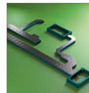
e RIVI Sistema pedonabile di canalizzazione cavi a pavimento