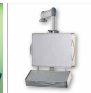
Sistema pensile di comando