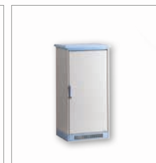
e VIS Soluzioni outdoor