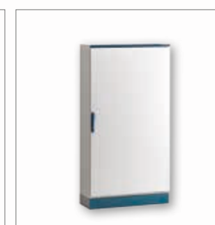
e comp Armadietti compatti