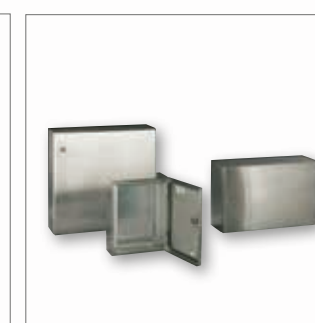
Soluzioni in acciaio inossidabile AISI304L (AISI316L su richiesta)