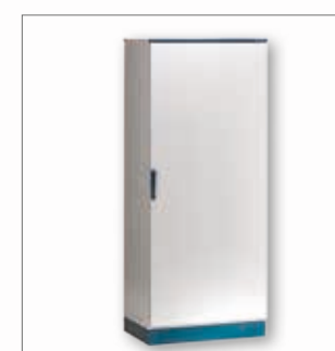
e max Armadi monoblocco

Quando nasce l'esigenza di avere soluzioni differenti dallo standard, E.T.A. analizza, studia e sviluppa il prodotto che meglio si adatta alle vostre applicazioni. Così, quando le necessità cambiano, le nostre capacità di personalizzazione si plasmano: sistemi di piegatura/punzonatura avanzati, tecnologia di taglio laser avanzata per l'esecuzione di forature ed un sistema di verniciatura automatico per colori RAL e finiture speciali.