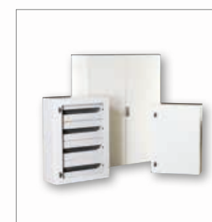
Casse con fissaggio a muro e casse di derivazione